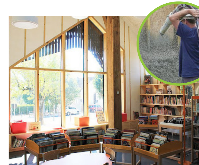
@ Dauphins architecture

Fibre de chanvre en vrac provenant de Chanvre Mellois. (association de producteurs agricoles) pour l'isolation des combles en rénovation (ATEX b).