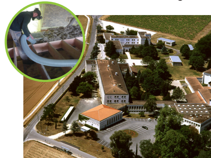
Lycée de l'Oisellerie (Charente)